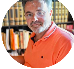
MATTEO GUARDINI SINDACO DI CAVRIANA