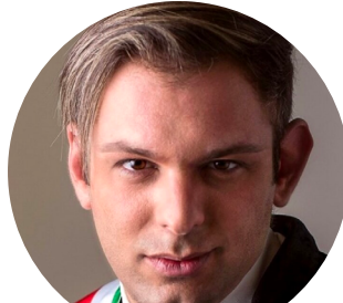
DAVIDE GARAVAGLIA SINDACO DI MESERO